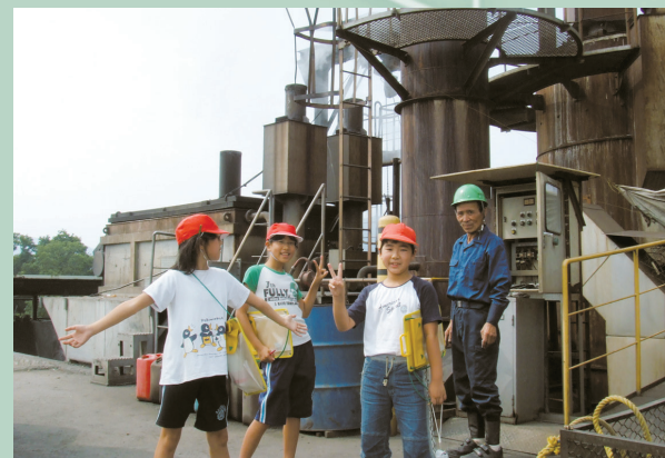
地元の大和小学校のみなさんによる社会見学の風景。