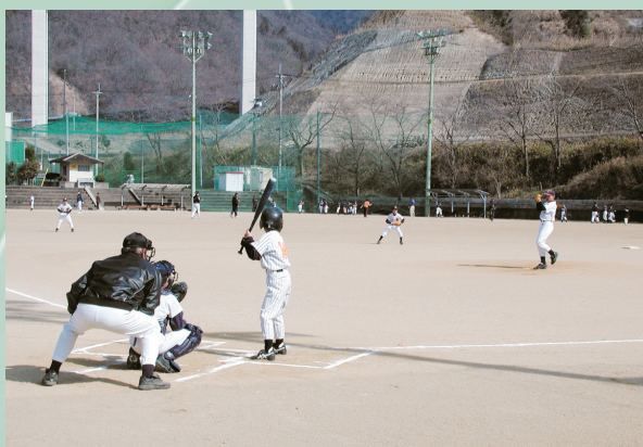
明和クリーンは地域の発展に貢献する活動を行っております。写真は、少年野球大会の開会式及び試合風景です。