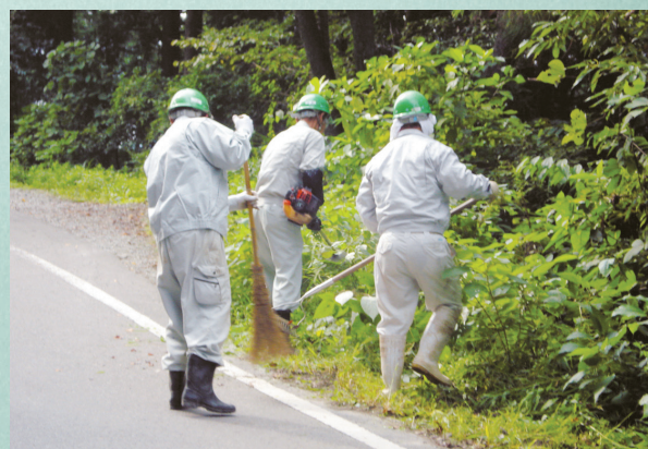
定期的に近隣の道路の清掃を行っています。