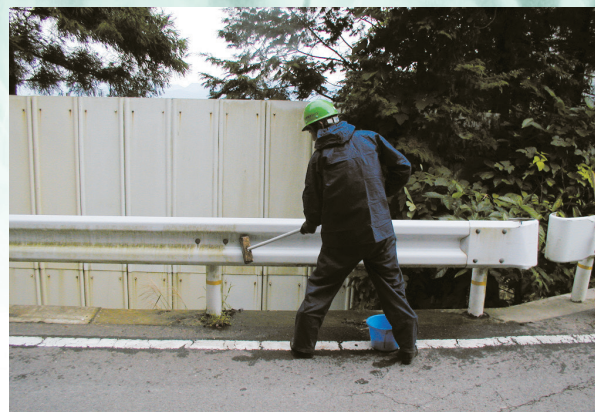
搬入路のガードレールも定期的に清掃を行っています。